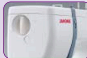
Pression du pied de biche réglable : Permet un entraînement régulier des tissus épais ou très fins et des tissus extensibles