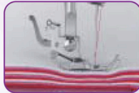
Couture dans les tissus épais grâce à la double hauteur du pied de biche et à la puissance de piqûre