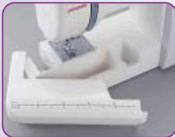
Table de couture avec les indications en inch et cm