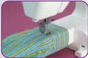
Bras libre pour les coutures circulaires (bas de pantalons manches...)