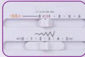
Réglage longueur et largeur des points