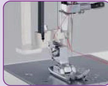
Enfilage automatique de l'aiguille