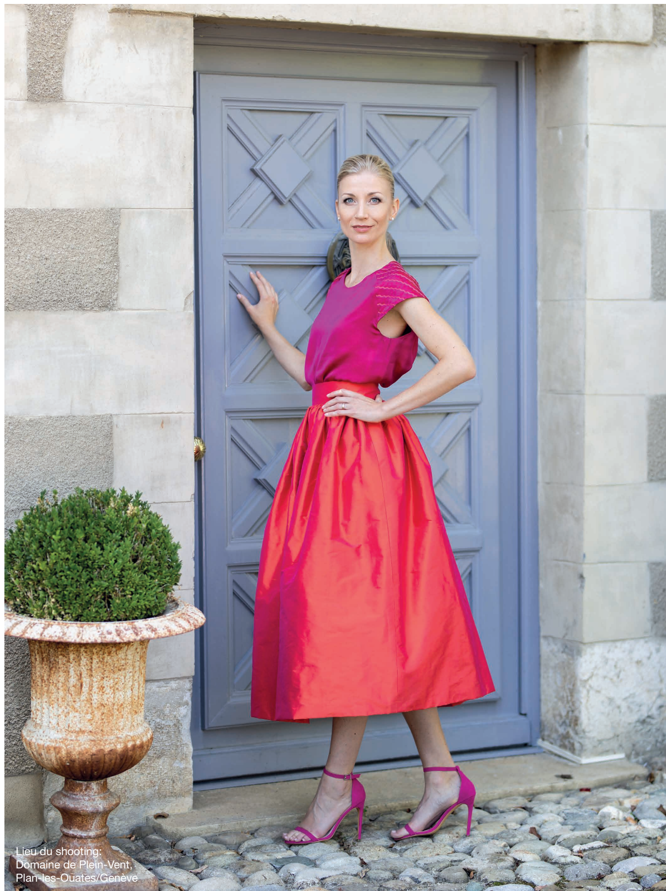
Lieu du shooting: Domaine de Plein-Vent, Plan-les-Ouates/Genève