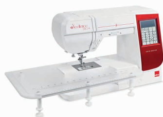
TABLE D'EXTENSION EXTRA-LARGE

Fournie avec nos modèles eXcellence, la table d'extension extra-large vous offre un espace de travail étendu pour réaliser des projets d'envergure (non comprise avec l'eXcellence 770).